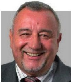
Zur Politikerfahrung Peter Radunski