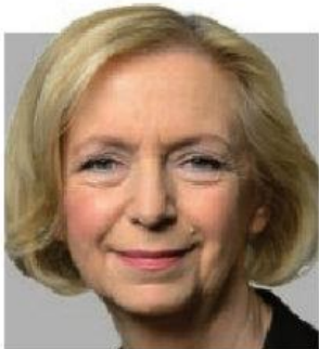
Zur Bildung Johanna Wanka